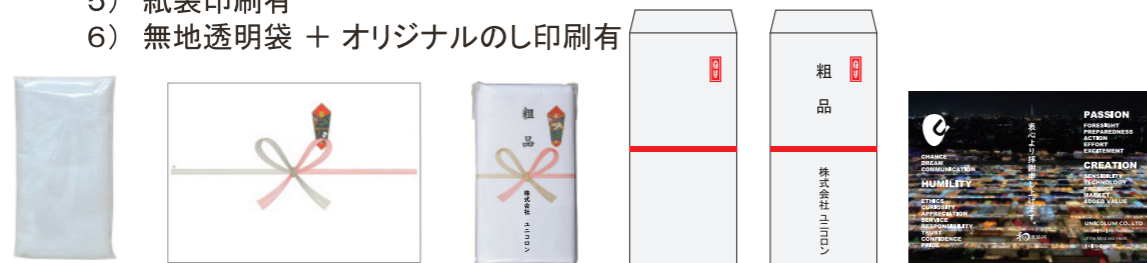
※オリジナル熨斗印刷のイメージ